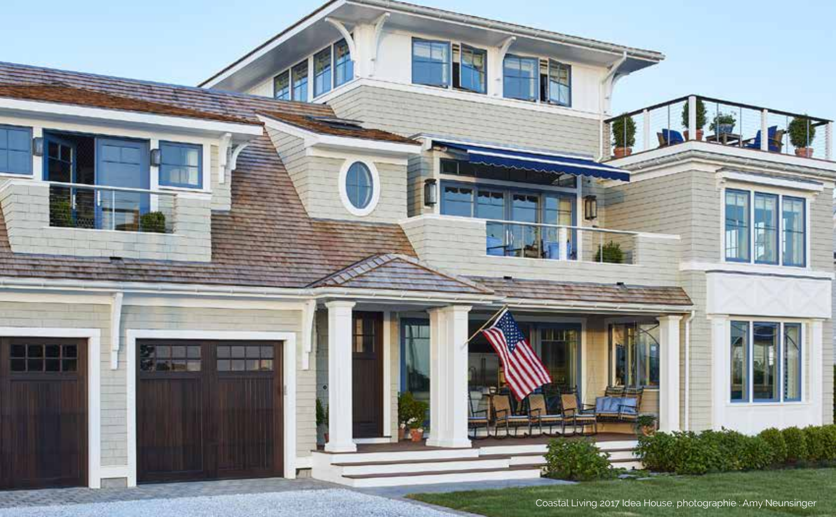
Coastal Living 2017 Idea House