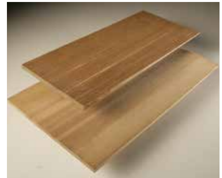
R&R No. 1

Sur demande, SBC offre aussi d'autres grades, épaisseurs et longueurs, en plus de bardeaux décoratifs qui ajouteront une touche unique à votre projet.